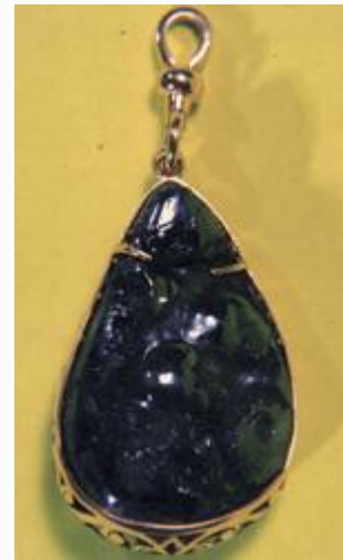
โคตรเหล็กไหล