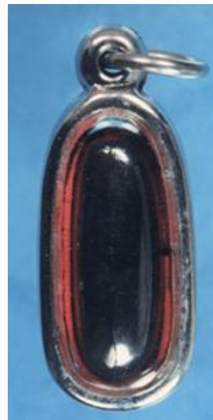
เหล็กไหลฤษี