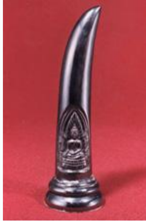
งาช้างเหล็กไหล