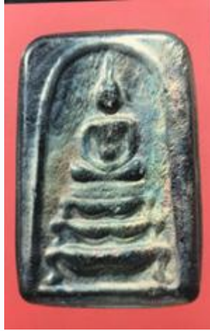
สมเด็จพระเหล็กไหล