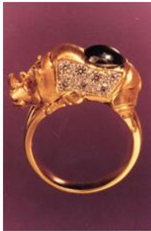
แหวนแรดเหล็กไหล