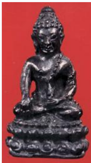
พระกริ่งเหล็กไหล