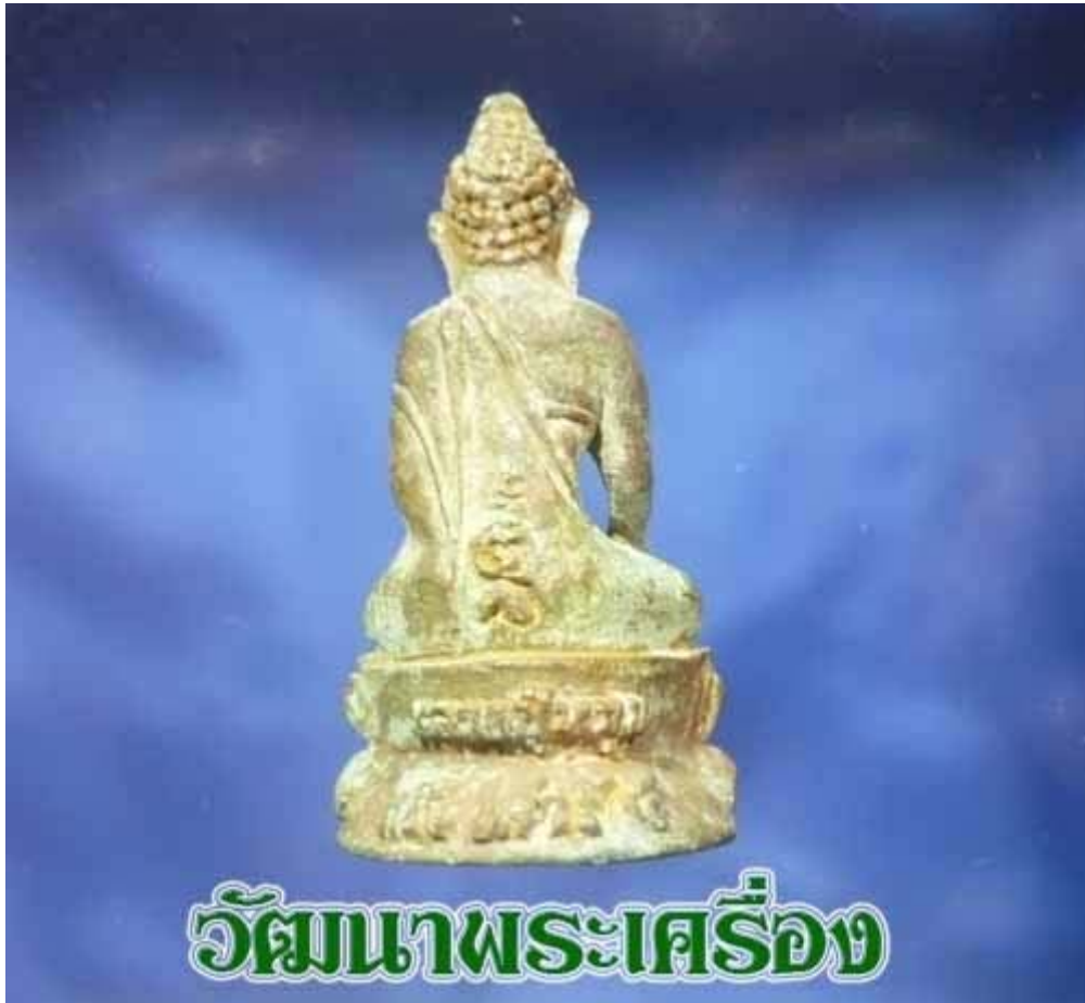
วัฒนาพระเครื่อง