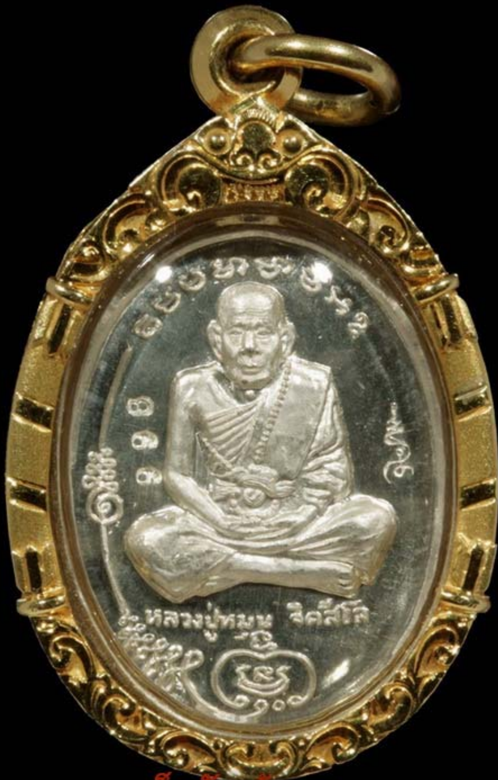
เด็กวัดบ้านจาน