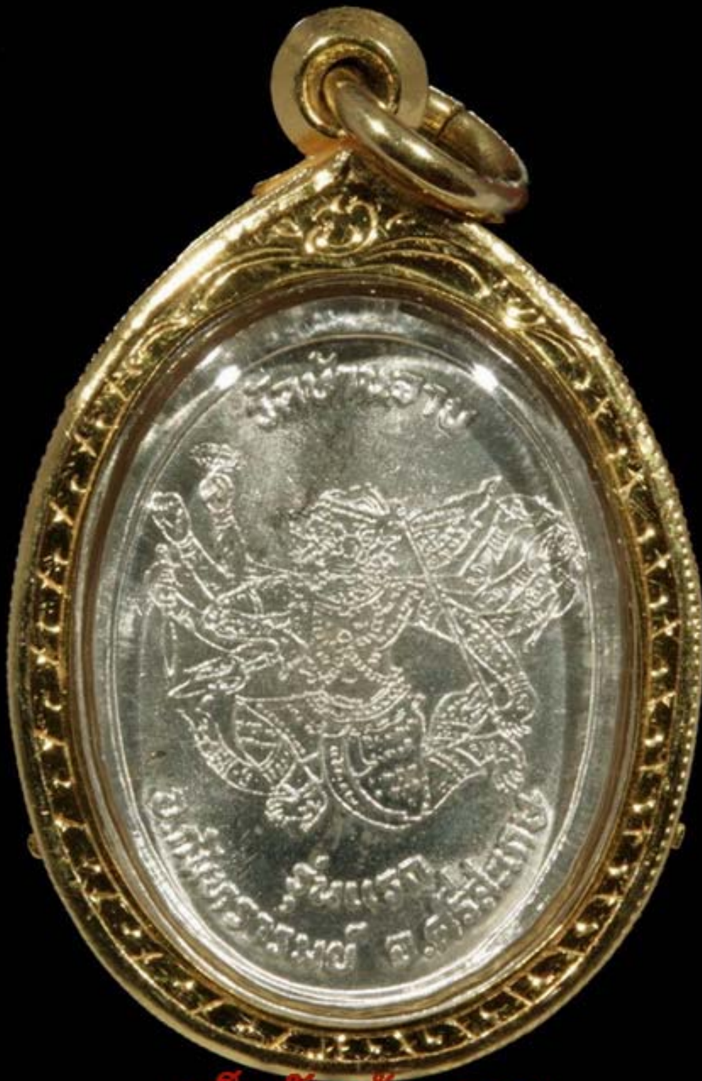
เด็กวัดบ้านจาน